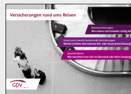
Versicherungen rund ums Reisen