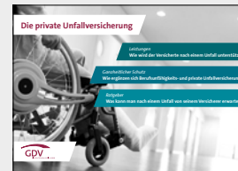
Die private Unfallversicherung