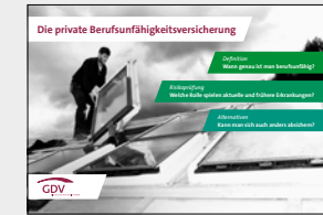
Die private Berufsunfähigkeitsversicherung