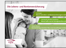
Die Lebens- und Rentenversicherung