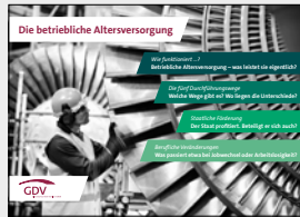
Die betriebliche Altersversorgung