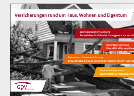
Versicherungen rund um Haus, Wohnen und Eigentum