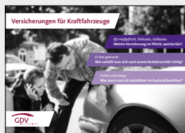
Versicherungen für Kraftfahrzeuge