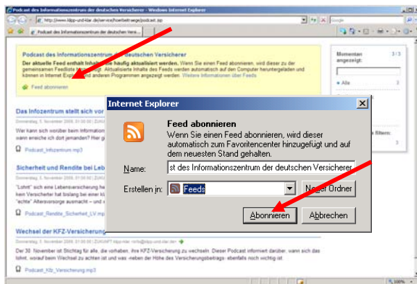
Darstellung Internet Explorer 7

Sie können den Podcast mit Ihrem bevorzugten RSS-Feed-Reader bzw. Podcatcher abonnieren, z.B. mit dem jeweiligen Feed-Reader Ihres Browsers, Google Reader oder einem sogenannten Podcatcher, z.B. dem Podcast-Dienst iTunes.